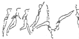
Salto de mãos à frente (10%)