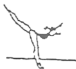
Posição de equilíbrio (5%)