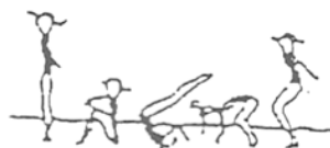
Rolamento à retaguarda (10%)