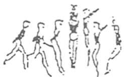
Corrida e salto em extensão com 1/2 volta (5%)