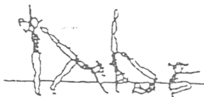
Apoio facial invertido, rolamento à frente (20%)

Construa uma sequência, com as diversas figuras, de forma a obter no mínimo 60% de média do valor global dos elementos técnicos.