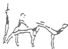
Posição de equilíbrio (avião, bandeira, etc.) (5%)